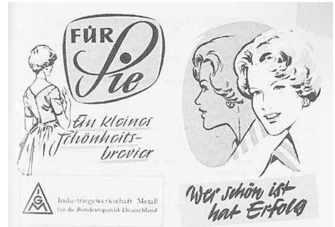
Werbefaltblatt der IG Metall 1959