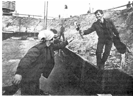
8. März auf einer Baustelle in der DDR