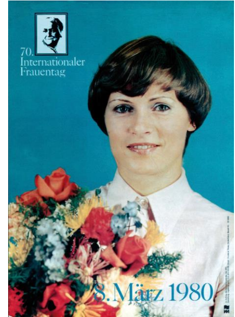
IG Metall Vorstand FB Zielgruppen und Gleichstellung