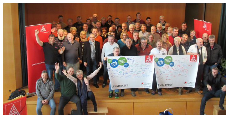
Delegierte der Wahlperiode 2016-2019