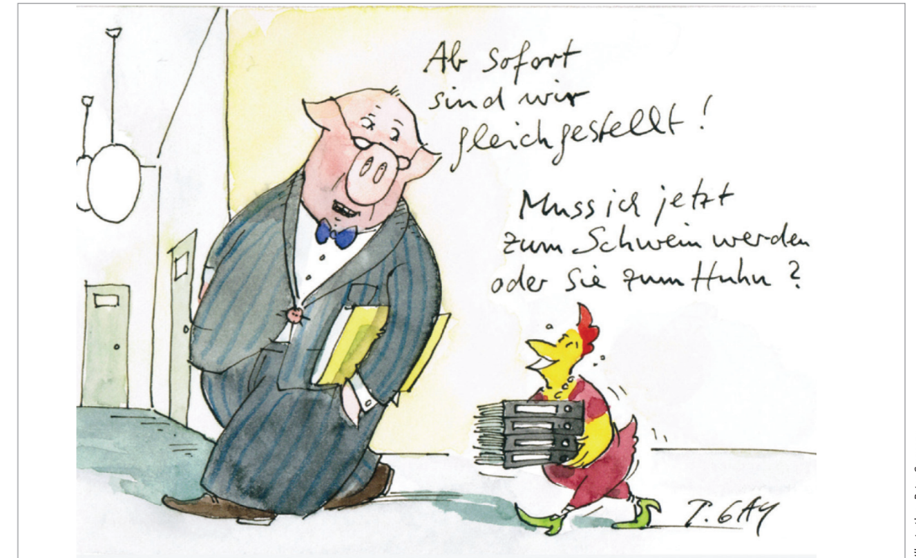
Illustration: Peter Gaymann