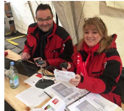
Streikposten bei Saxonian in Göppingen (links), Teilnehmer-Erfassung bei Mahle in Rottweil