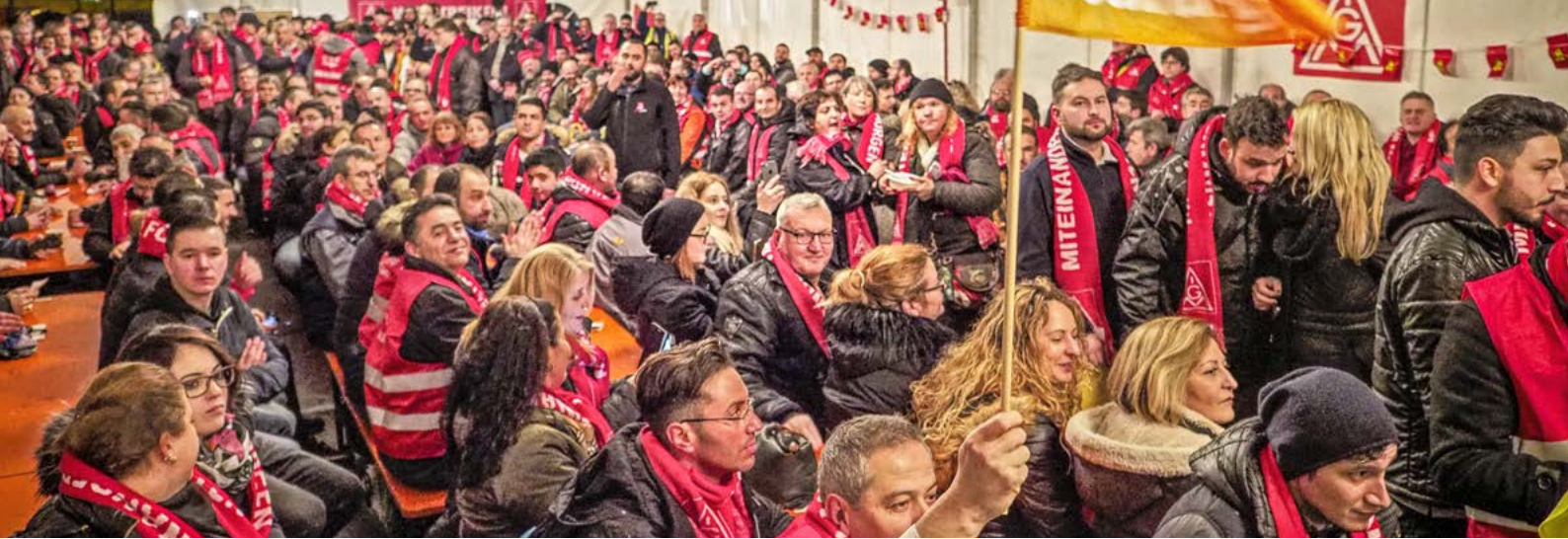
Warnstreik-Versammlung in der Spätschicht bei Bosch in Stuttgart-Feuerbach