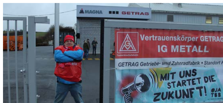
Strikposten bei Magna Getrag Powertrain in Rosenberg