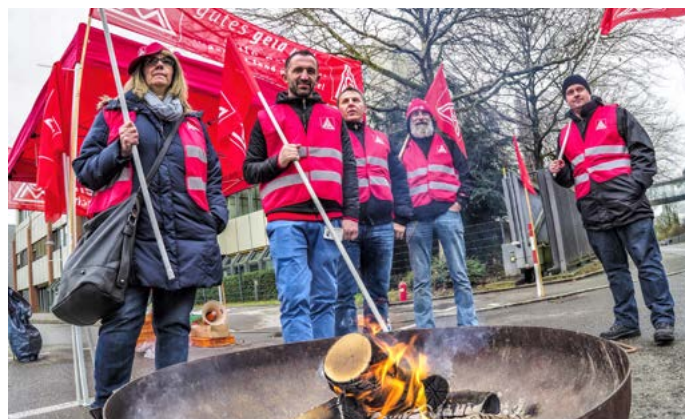
Aktion bei Automotive Lighting und Bosch in Reutlingen