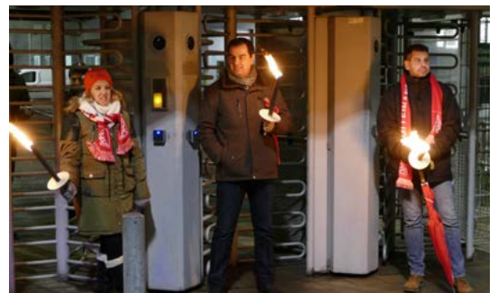
v.l.n.r.: Warnstreik-Verpflegung bei Wabco in Mannheim, Kundgebung bei Ceratizit in Empfingen und Torwache bei Valeo in Bietigheim-Bissingen

Herausgeber: IG Metall Bezirksleitung Baden-Württemberg, Stuttgarter Straße 23, 70469 Stuttgart, Verantwortlich: Petra Oles, Telefon (0711) 16581-0, Fax (0711) 16581-30, E-Mail: bezirk.baden-wuerttemberg@igmetall.de, www.bw-igm.de; Druck: apm AG, Darmstadt